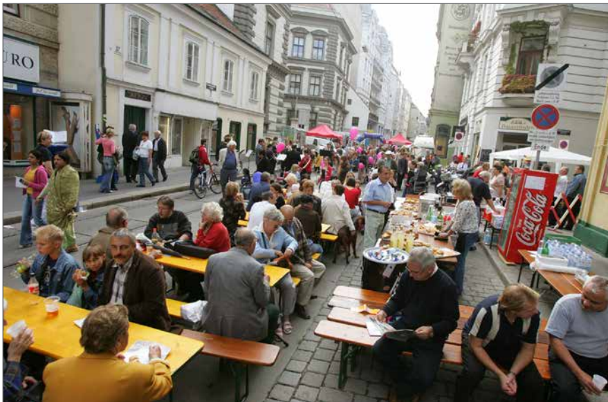
Stadt Wien Marketing